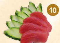
10 Maguro sashimi tonijn (4 st)