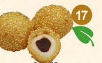
17 Sesamballen sesam kleefrijst