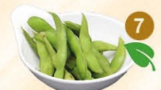
7 Edamame sojabonen