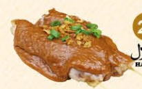
29 Kipspies met sate saus halal