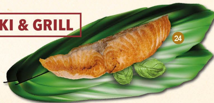
24 Gegrilde zalm met knoflooksaus