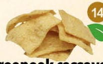
14 Kroepoek cassave spicy veggie