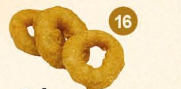
16 Calamars Inktvisringen