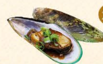
26 Mosselen half shell mosselen