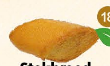
18 Stokbrood brood