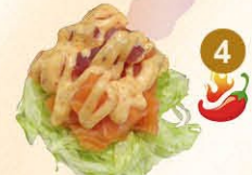
4 Sashimi salade verse zalm en tonijn blokjes