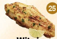
25 Wit vis met knoflooksaus