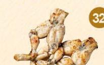
32 Kikkerbillen met knoflooksaus