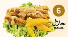
6 Mango & kip salade mango & kip