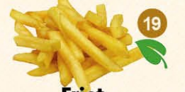
19 Friet aardappel