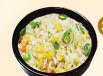
39 Nasi gebakken rijst