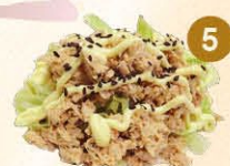
5 Tonijn salade gekookte tonijn