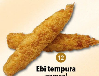
12 Ebi tempura garnaal