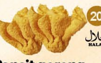
20 Pansit goreng gevuld met kip