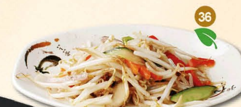
36 Tjap Tjoi groenten mix