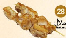
28 Yakitori kip halal