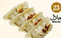
23 Gyoza kip kip, halal