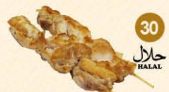
30 Kipspies met kerrie saus halal