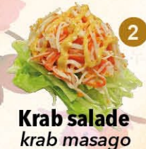
2 Krab salade krab masago