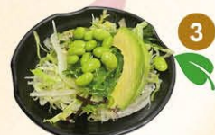
3 Poke bowl veggie sojabonen, avocado, zeewier en komkommer