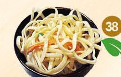
38 Bami gebakken bami