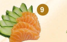
9 Sake sashimi zalm (4 st)