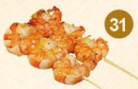
31 Garnalenspies met knoflooksaus 2 stokjes