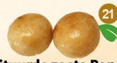
21 Gefrituurde zoete Bapao zoete melksaus apart