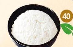
40 Witte rijst witte rijst