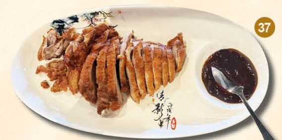
37 Pekingend met hoisin saus