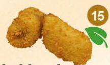
15 Gebakken banaan banaan