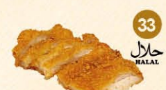
33 Panko kip met kerrie saus halal