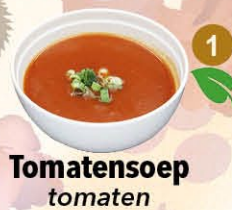
1 Tomatensoep tomaten