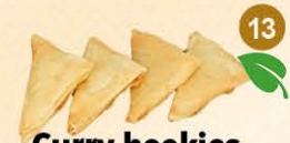
13 Curry hoekjes (4 st)