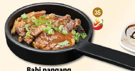
35 Babi pangang varkensreepjes met zoet-pikante saus