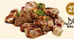
27 Teriyaki biefblokjes halal