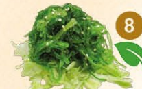
8 Chuka wakame zeewier salade