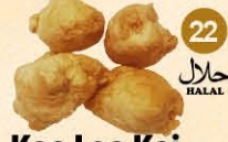
22 Koe Loe Kai gefr. kippenballetjes, halal