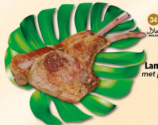
34 Lamskotelet met pepersaus, halal